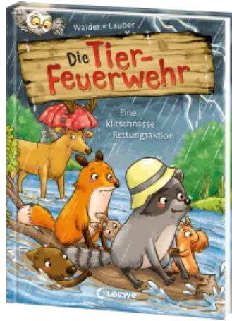
Die Tier-Feuerwehr (Band 2) - Eine klitschnasse Rettungsaktion Hardcover