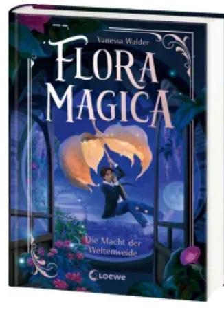
Flora Magica (Band 3) - Die Macht der Weltenweide Hardcover