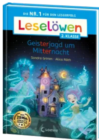
Leselöwen 2. Klasse - Geisterjagd um Mitternacht Hardcover