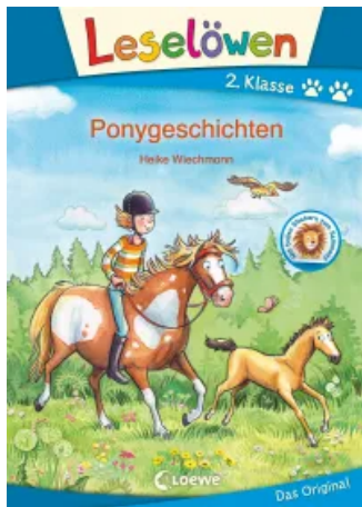
Leselöwen 2. Klasse - Ponygeschichten Hardcover