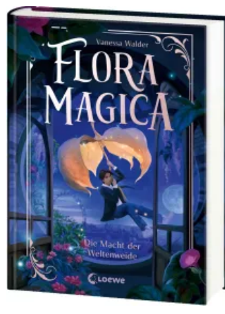
Flora Magica (Band 3) - Die Macht der Weltenweide Hardcover