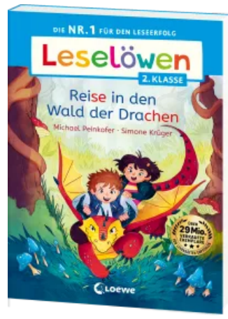
Leselöwen 2. Klasse - Reise in den Wald der Drachen Taschenbuch