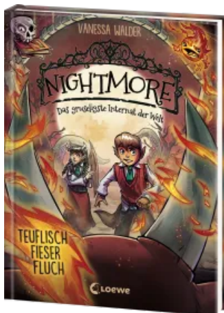
Nightmore - Das gruseligste Internat der Welt (Band 3) - Teuflich fieser Fluch Hardcover