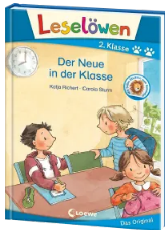
Leselöwen 2. Klasse - Der Neue in der Klasse Hardcover