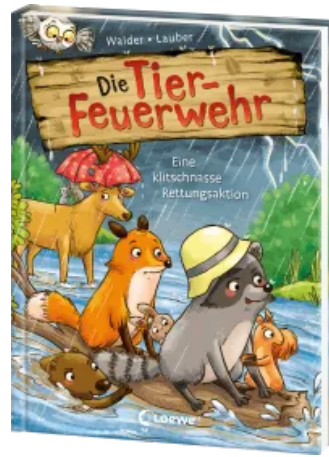
Die Tier-Feuerwehr (Band 2) - Eine klitschnasse Rettungsaktion Hardcover