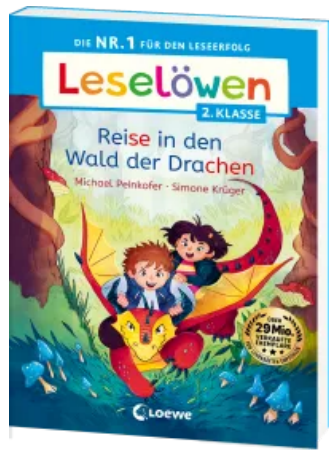
Leselöwen 2. Klasse - Reise in den Wald der Drachen Taschenbuch