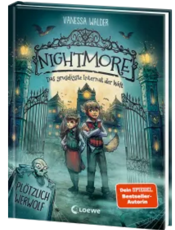
Nightmore - Das gruseligste Internat der Welt (Band 1) - Plötzlich Werwolf Hardcover