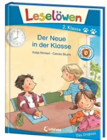
Leselöwen 2. Klasse - Der Neue in der Klasse Hardcover