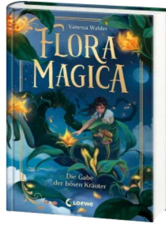
Flora Magica (Band 2) - Die Gabe der bösen Kräuter Hardcover