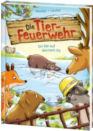
Die Tier-Feuerwehr (Band 3) - Ein Bär auf dünnem Eis Hardcover