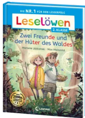
Leselöwen 2. Klasse - Zwei Freunde und der Hüter des Waldes Hardcover