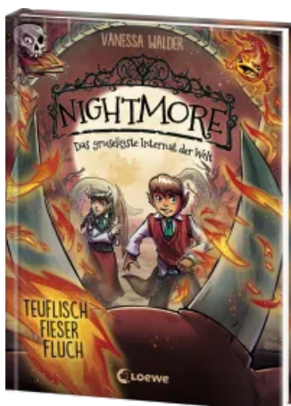
Nightmore - Das gruseligste Internat der Welt (Band 3) - Teuflich fieser Fluch Hardcover