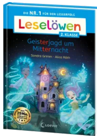
Leselöwen 2. Klasse - Geisterjagd um Mitternacht Hardcover