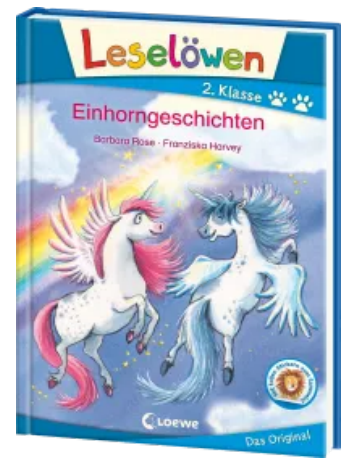
Leselöwen 2. Klasse - Einhorn Geschichten Hardcover