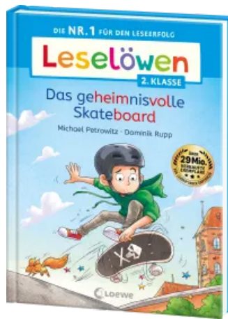
Leselöwen 2. Klasse - Das geheimnisvolle Skateboard Hardcover