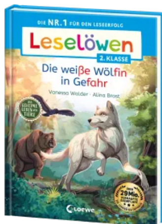
Leselöwen 2. Klasse - Das geheime Leben der Tiere - Die weiße Wölfin in Gefahr Hardcover