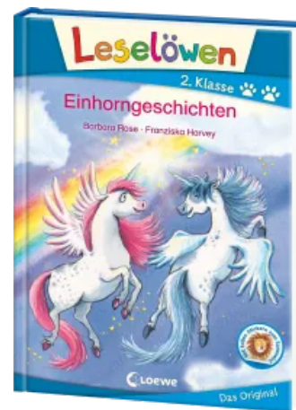
Leselöwen 2. Klasse - Einhorngeschichten Hardcover