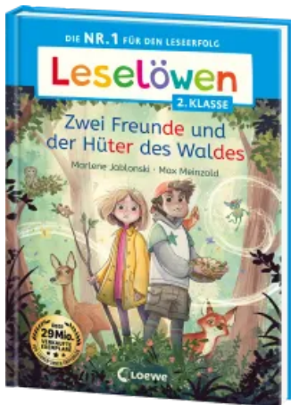
Leselöwen 2. Klasse - Zwei Freunde und der Hüter des Waldes Hardcover