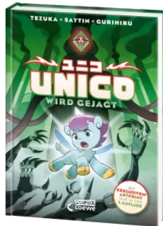
Unico wird gejagt (Band 2) Hardcover