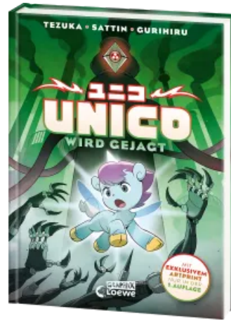
Unico wird gejagt (Band 2)