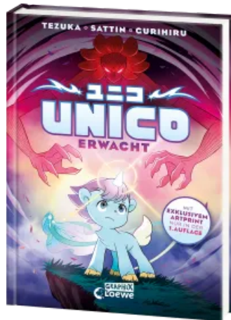
Unico erwacht (Band 1) Hardcover