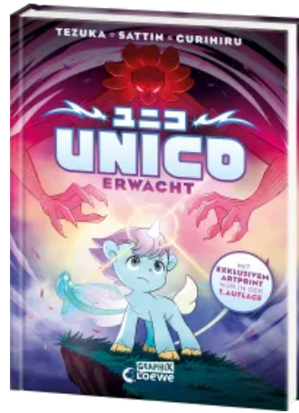
Unico erwacht (Band 1)