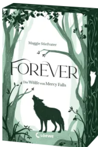
Forever (Die Wölfe von Mercy Falls, Band 3)