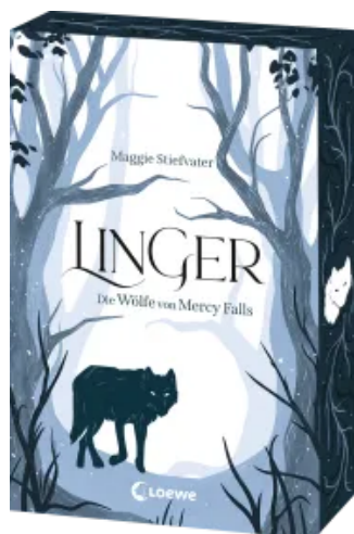
Linger (Die Wölfe von Mercy Falls, Band 2)