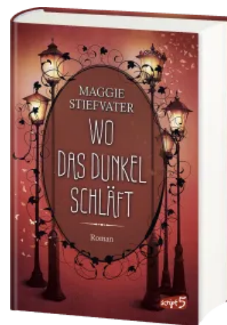
Wo das Dunkel schläft (Band 4)