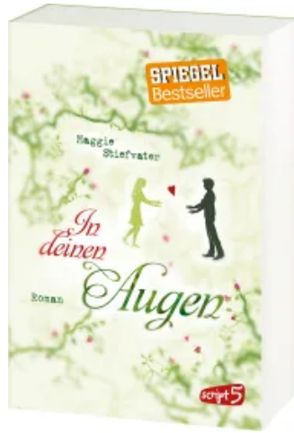
In deinen Augen Taschenbuch