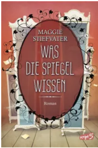
Was die Spiegel wissen (Raven Boys 3) Hardcover