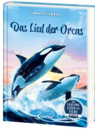
Das geheime Leben der Tiere (Meer) - Das Lied der Orcas Hardcover