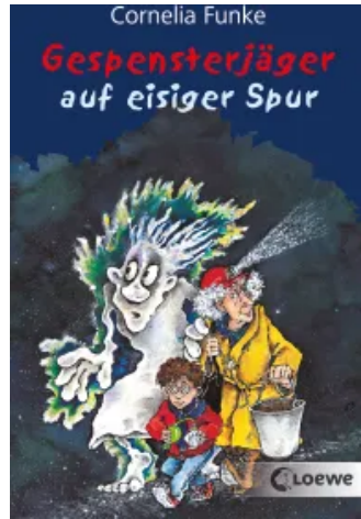
Gespensterjäger auf eisiger Spur (Band 1) Taschenbuch