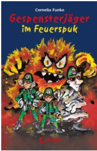
Gespensterjäger im Feuerspuk Hardcover