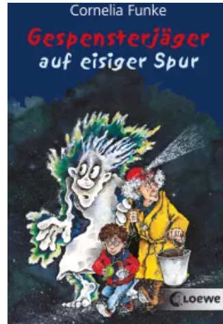
Gespensterjäger auf eisiger Spur Taschenbuch