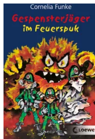
Gespensterjäger im Feuerspuk Taschenbuch