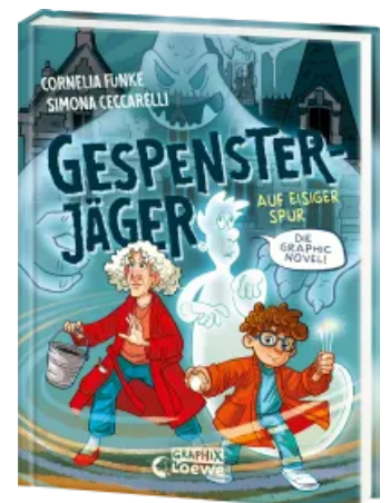
Gespensterjäger auf eisiger Spur (Band 1) - Die Graphic Novel Hardcover