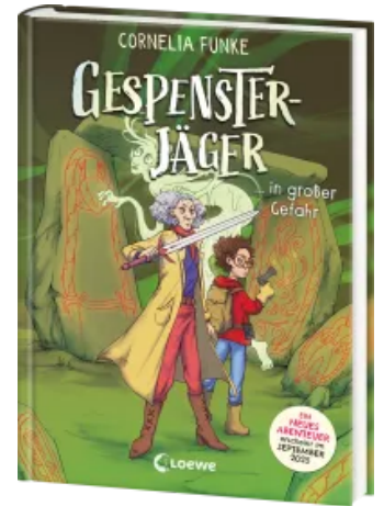
Gespensterjäger in großer Gefahr (Band 4) - Mit 8 neu illustrierten Farbseiten Hardcover