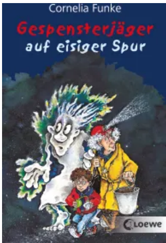
Gespensterjäger auf eisiger Spur Taschenbuch