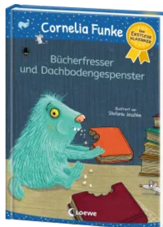
Bücherfresser und Dachbodengespenster Hardcover