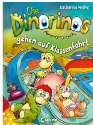
Die Dinorinos gehen auf Klassenfahrt (Band 5) Hardcover