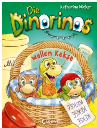
Die Dinorinos wollen Kekse (Band 2) Hardcover