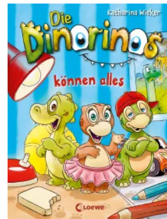
Die Dinorinos können alles (Band 1) Hardcover