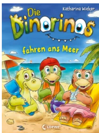
Die Dinorinos fahren ans Meer (Band 4) Hardcover