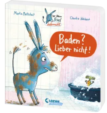
Der kleine Esel Lieber nicht - Baden? Lieber nicht! Hardcover