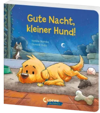
Gute Nacht, kleiner Hund! Hardcover