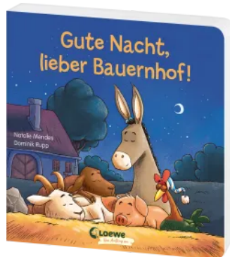
Gute Nacht, lieber Bauernhof! Hardcover