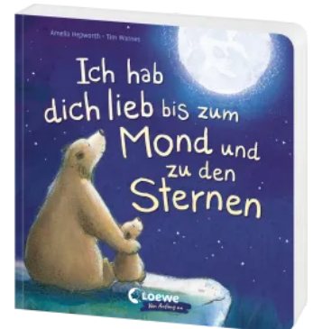
Ich hab dich lieb bis zum Mond und zu den Sternen Hardcover