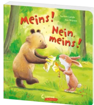
Meins! Nein, meins! Hardcover