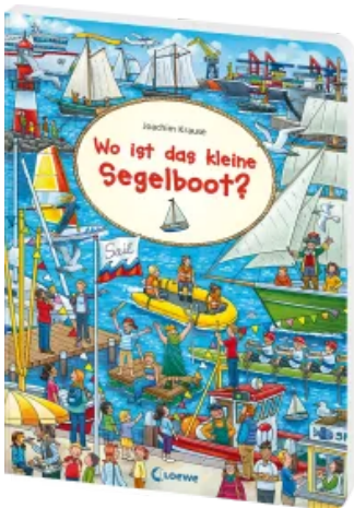
Wo ist das kleine Segelboot? Hardcover