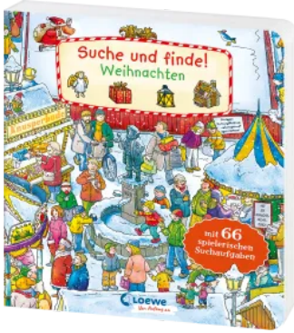
Suche und finde! - Weihnachten Hardcover