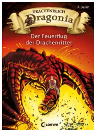
Drachenreich Dragonica (Band 2) – Der Feuerflug der Drachenritter Unbekannt