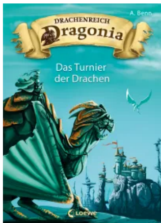
Drachenreich Dragonica (Band 4) – Das Turnier der Drachen Hardcover