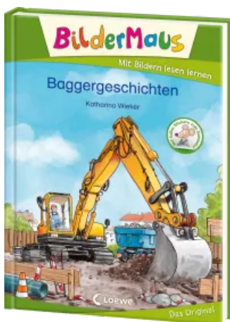
Bildermaus - Baggergeschichten Hardcover