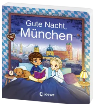
Gute Nacht, München Hardcover