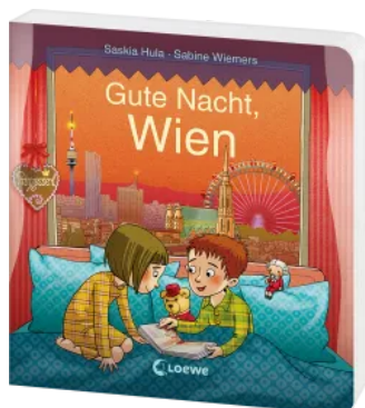
Gute Nacht, Wien Hardcover