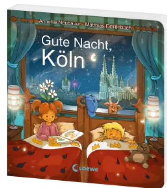
Gute Nacht, Köln Hardcover