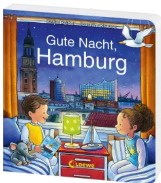
Gute Nacht, Hamburg Hardcover