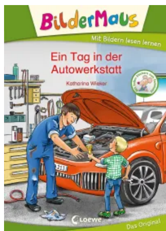
Bildermaus - Ein Tag in der Autowerkstatt Hardcover