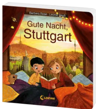
Gute Nacht, Stuttgart Hardcover