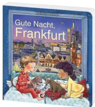
Gute Nacht, Frankfurt Hardcover