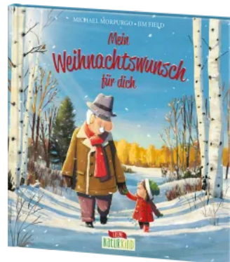
Mein Weihnachtswunsch für dich Hardcover