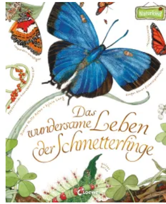
Das wundersame Leben der Schmetterlinge Hardcover