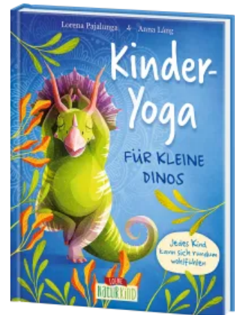
Kinder-Yoga für kleine Dinos Hardcover