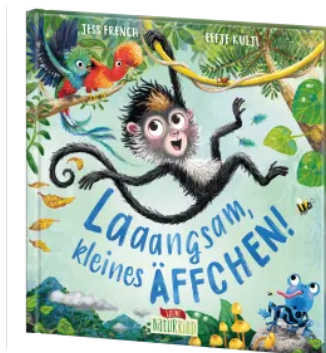
Laaangsam, kleines Äffchen! Hardcover