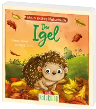
Mein erstes Naturbuch - Der Igel Hardcover