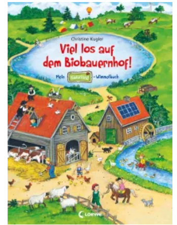
Viel los auf dem Biobauernhof! Hardcover