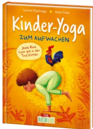
Kinder-Yoga zum Aufwachen Hardcover