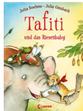
Tafiti und das Riesenbaby (Band 3) Hardcover