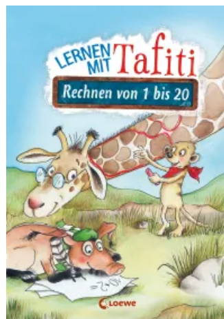
Lernen mit Tafiti - Rechnen von 1 bis 20 Taschenbuch