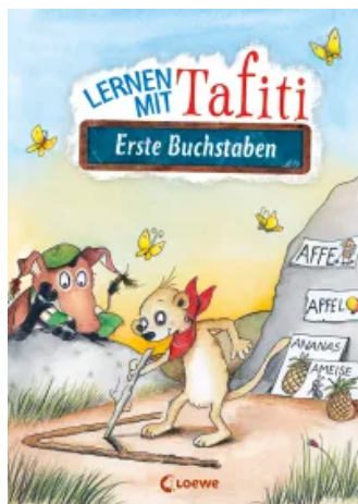
Lernen mit Tafiti - Erste Buchstaben Taschenbuch