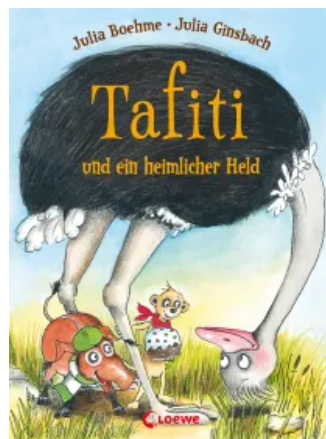
Tafiti und ein heimlicher Held (Band 5) Hardcover