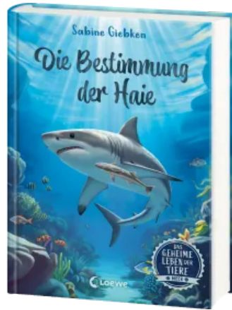
Das geheime Leben der Tiere (Meer) - Die Bestimmung der Haie Hardcover