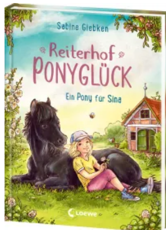
Reiterhof Ponyglück (Band 1) - Ein Pony für Sina Hardcover