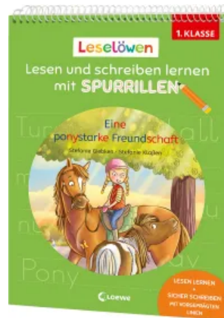
Leselöwen - Lesen und schreiben lernen mit Spurrillen - Eine ponystarke Freundschaft Taschenbuch