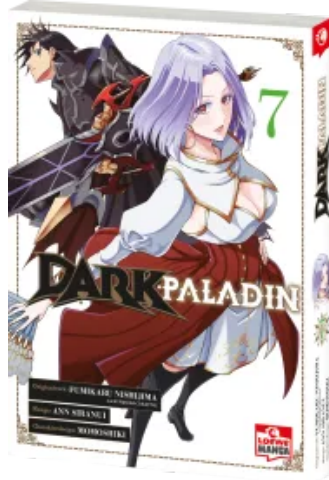
Dark Paladin 07 Taschenbuch