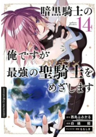
Dark Paladin 14 Taschenbuch