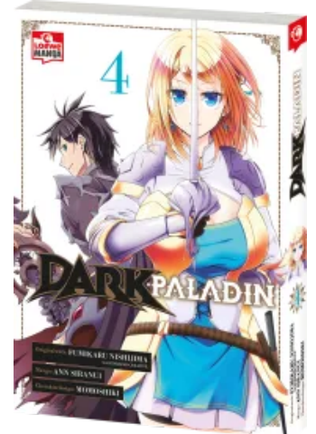
Dark Paladin 04 Taschenbuch