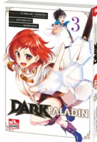
Dark Paladin 03 Taschenbuch