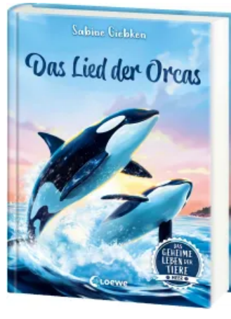
Das geheime Leben der Tiere (Meer) - Das Lied der Orcas Hardcover