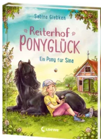
Reiterhof Ponyglück (Band 1) - Ein Pony für Sina Hardcover