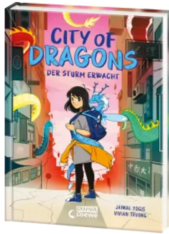
City of Dragons (Band 1) - Der Sturm erwacht Hardcover