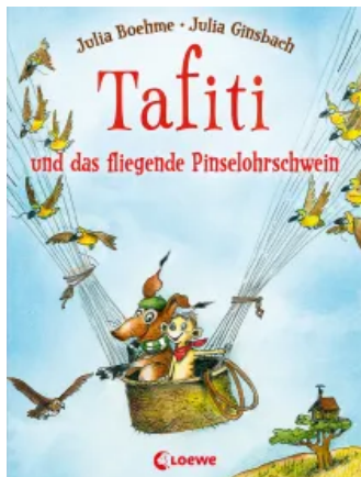
Tafiti und das fliegende Pinselohrschwein (Band 2) Hardcover

Tafiti und die Reise ans Ende der Welt (Band 1) Sonderausgabe