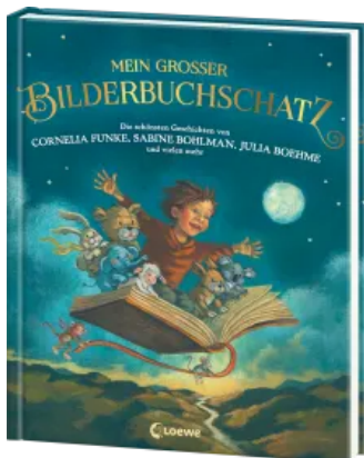
Mein großer Bilderbuchschatz Hardcover