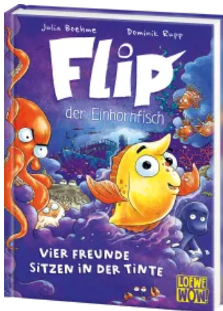
Flip, der Einhornfisch (Band 2) - Vier Freunde sitzen in der Tinte Hardcover