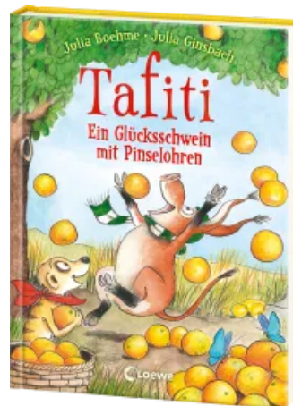
Tafiti (Band 24) - Ein Glücksschwein mit Pinselohren Hardcover