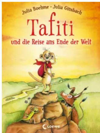
Tafiti und die Reise ans Ende der Welt (Band 1) Hardcover