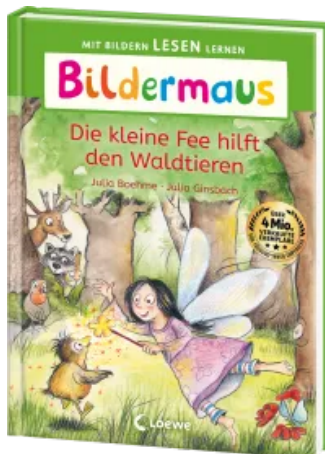
Bildermaus - Die kleine Fee hilft den Waldtieren Hardcover