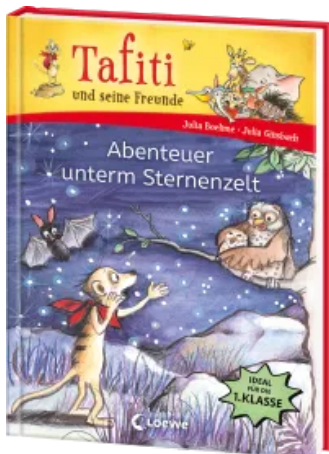
Tafiti und seine Freunde (Band 2) - Abenteuer unterm Sternenzelt Hardcover