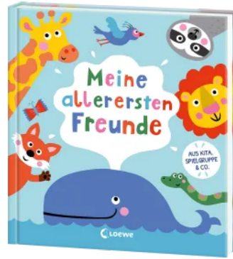
Meine allerersten Freunde Hardcover