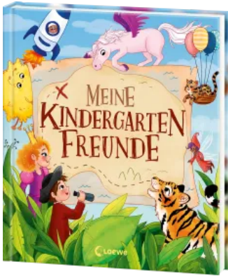
Meine Kindergarten-Freunde (Magische Wesen, Tiere & Co.) Hardcover