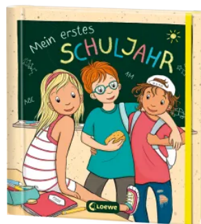
Mein erstes Schuljahr Hardcover