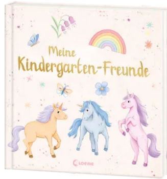
Meine Kindergarten-Freunde (neu) - Einhörner Hardcover