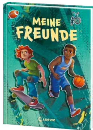
Meine Freunde (Sport) Hardcover