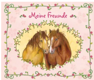
Meine Freunde (Pferde) Hardcover