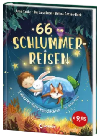
66 Schlummerreisen - 3-Minuten-Vorlesegeschichten zur Guten Nacht Hardcover