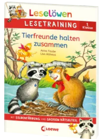
Der Zauberschüler (Band 7) Leselöwen Lesetraining 1. - Die verschwundene Klasse - Tierfreunde halten Waldfee zusammen Hardcover Taschenbuch