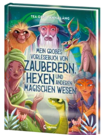
Mein großes Vorlesebuch von Zaubern, Hexen und anderen magischen Wesen Hardcover