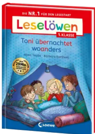
Leselöwen 1. Klasse - Toni übernachtet woanders Hardcover