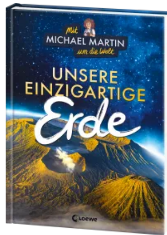
Mit Michael Martin um die Welt - Unsere einzigartige Erde Hardcover