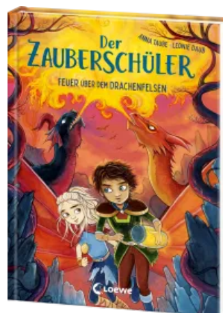
Der Zauberschüler (Band 6) - Feuer über dem Drachenfelsen Hardcover