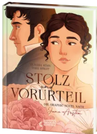
Stolz und Vorurteil - Die Graphic Novel nach Jane Austen Hardcover