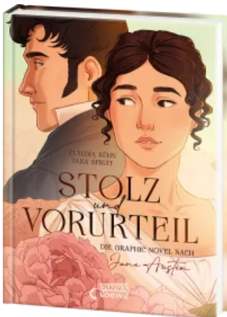
Stolz und Vorurteil - Die Graphic Novel nach Jane Austen Hardcover