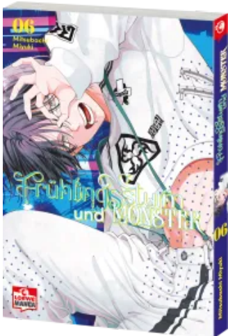
Frühlingsturm und Monster 06 Taschenbuch