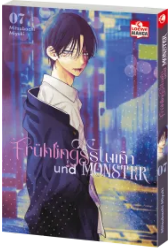
Frühlingsturm und Monster 07 Taschenbuch