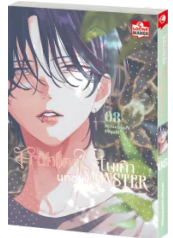
Frühlingsturm und Monster 08 Taschenbuch