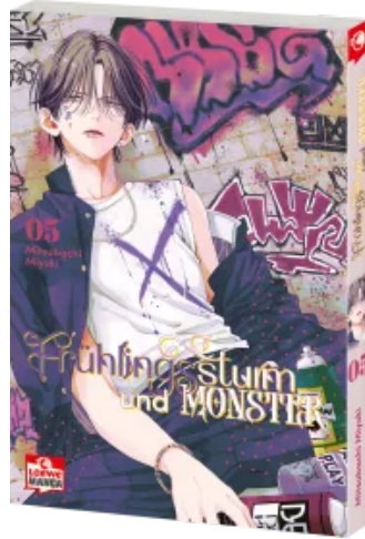
Frühlingsturm und Monster 05 Taschenbuch