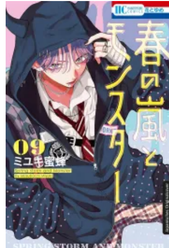
Frühlingsturm und Monster 09 Taschenbuch