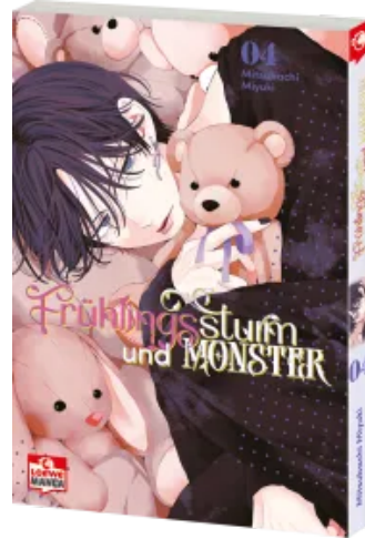
Frühlingsturm und Monster 04 Taschenbuch