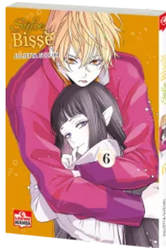
Süße Bisse 06 Taschenbuch