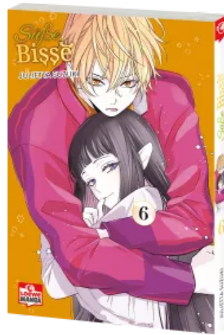
Süße Bisse 06 Taschenbuch