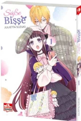
Süße Bisse 01 Taschenbuch