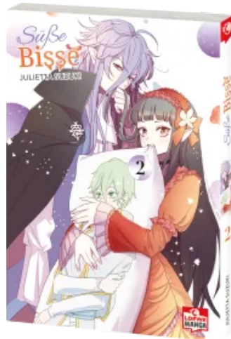
Süße Bisse 02 Taschenbuch