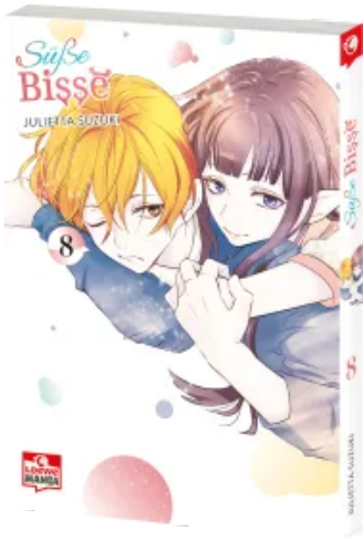
Süße Bisse 08 Taschenbuch