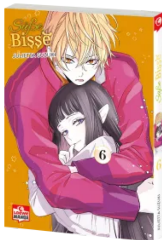
Süße Bisse 06 Taschenbuch