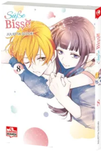
Süße Bisse 08 Taschenbuch