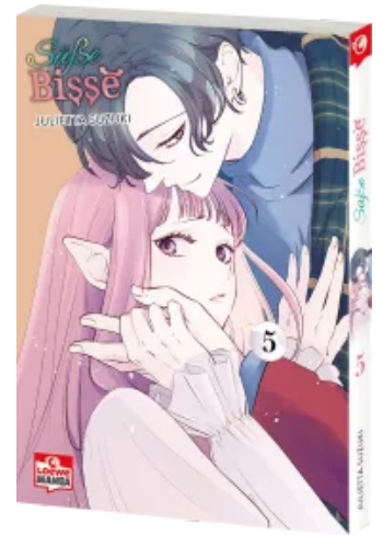
Süße Bisse 05 Taschenbuch