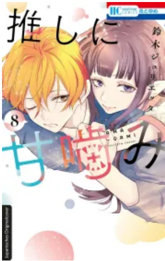
Süße Bisse 08 Taschenbuch