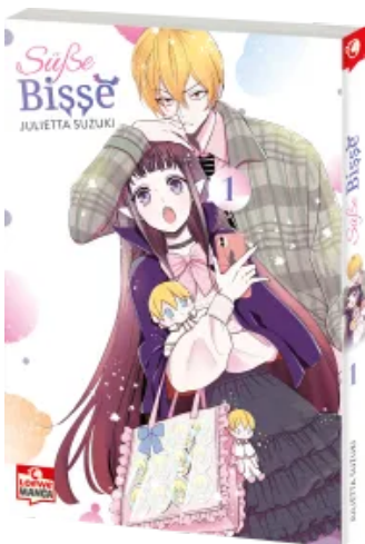
Süße Bisse 01 Taschenbuch