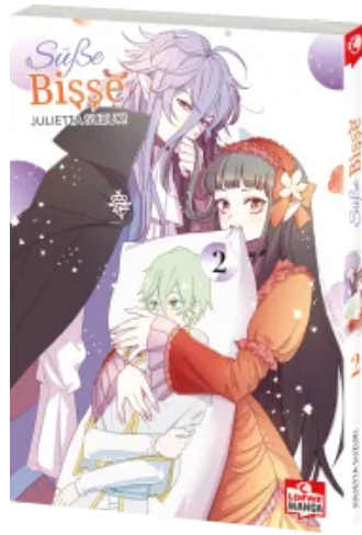
Süße Bisse 02 Taschenbuch