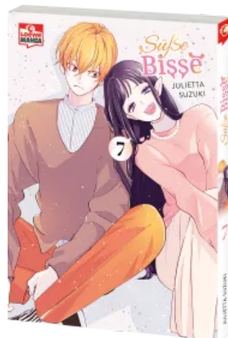
Süße Bisse 07 Taschenbuch