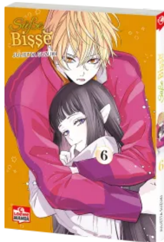
Süße Bisse 06 Taschenbuch