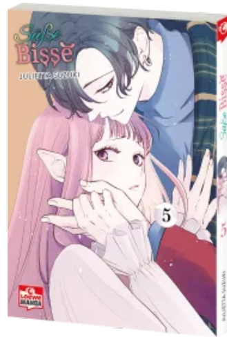
Süße Bisse 05 Taschenbuch