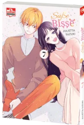
Süße Bisse 07 Taschenbuch