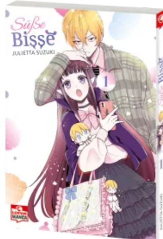
Süße Bisse 01 Taschenbuch