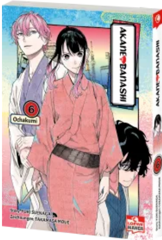
Akane-banashi 06 Taschenbuch