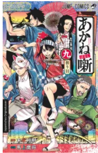
Akane-banashi 09 Taschenbuch