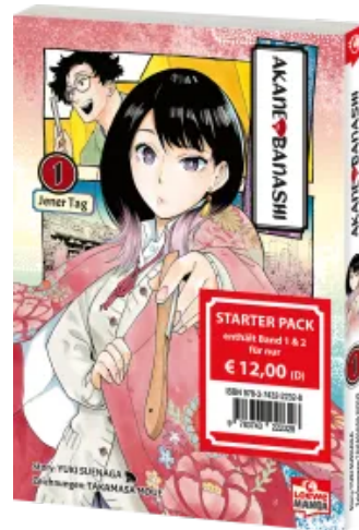
Akane-banashi Starter Pack Taschenbuch