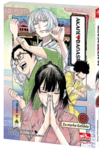
Akane-banashi 08 Taschenbuch