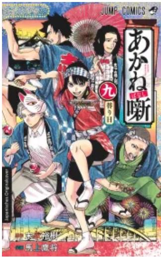
Akane-banashi 09 Taschenbuch