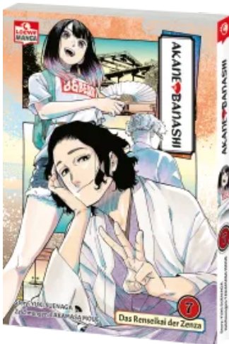
Akane-banashi 07 Taschenbuch