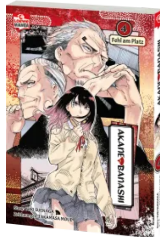
Akane-banashi 04 Taschenbuch