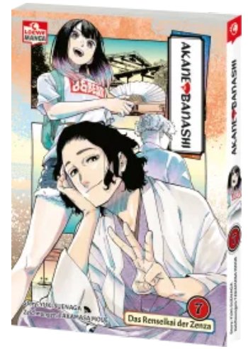
Akane-banashi 07 Taschenbuch