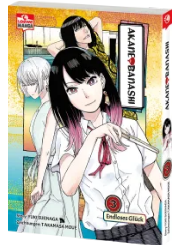
Akane-banashi 03 Taschenbuch