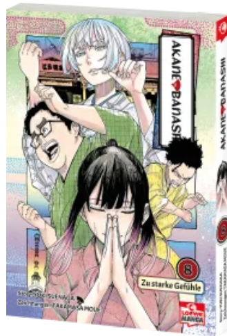
Akane-banashi 08 Taschenbuch