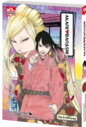
Akane-banashi 05 Taschenbuch