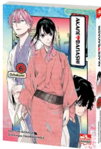
Akane-banashi 06 Taschenbuch