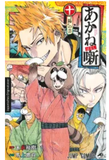
Akane-banashi 10 Taschenbuch