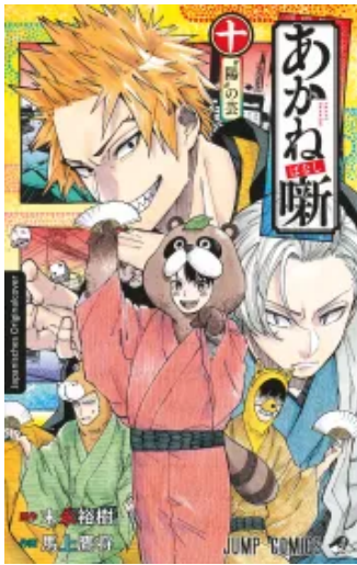
Akane-banashi 10 Taschenbuch