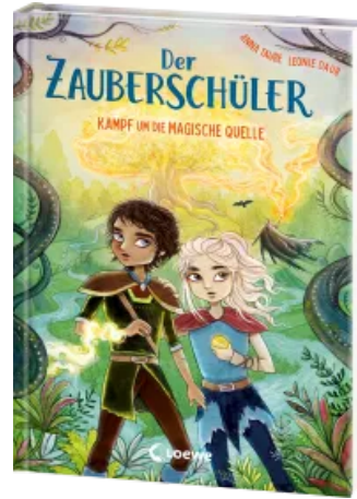
Der Zauberschüler (Band 4) - Kampf um die magische Quelle Hardcover