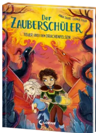
Der Zauberschüler (Band 6) - Feuer über dem Drachenfelsen Hardcover