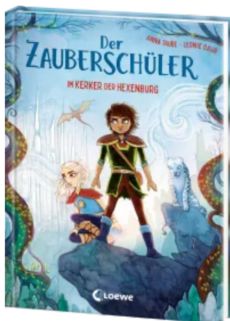
Der Zauberschüler (Band 5) - Im Kerker der Hexenburg Hardcover