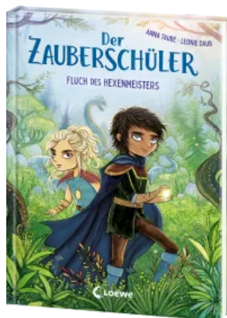
Der Zauberschüler (Band 1) - Fluch des Hexenmeisters Hardcover