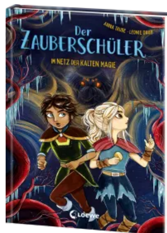
Der Zauberschüler (Band 8) - Im Netz der kalten Magie Hardcover