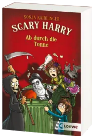
Scary Harry (Band 4) - Ab durch die Tonne Taschenbuch