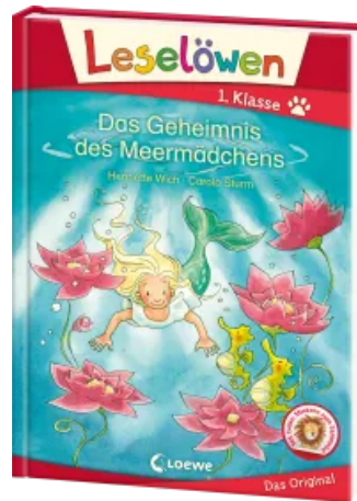
Leselöwen 1. Klasse - Das Geheimnis des Meermädchens Hardcover