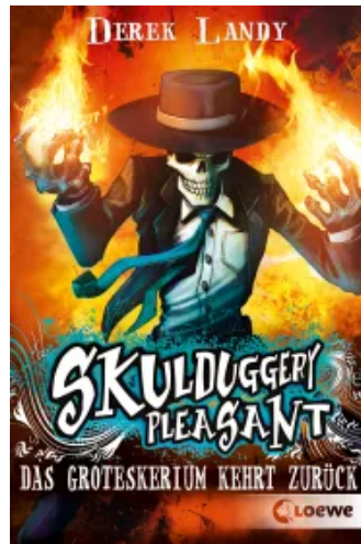
Skulduggery Pleasant (Band 2) - Das Groteskerium kehrt zurück Taschenbuch