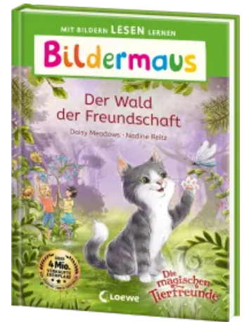
Bildermaus - Der Wald der Freundschaft Hardcover