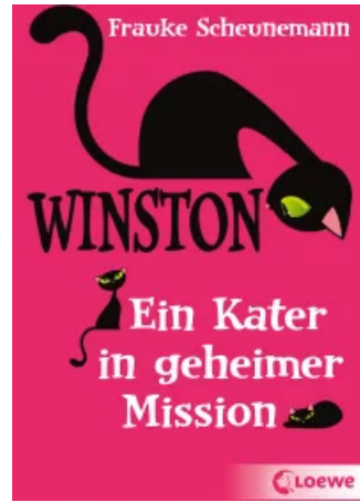
Winston (Band 1) - Ein Kater in geheimer Mission Taschenbuch