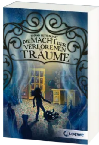
Die Macht der verlorenen Träume Taschenbuch