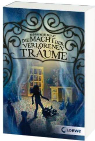
Die Macht der verlorenen Träume Taschenbuch