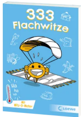
333 Flachwitze Taschenbuch