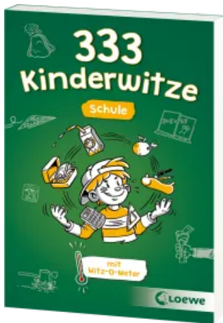
333 Kinderwitze - Schule Taschenbuch