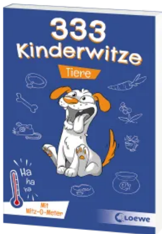
333 Kinderwitze - Tiere Taschenbuch