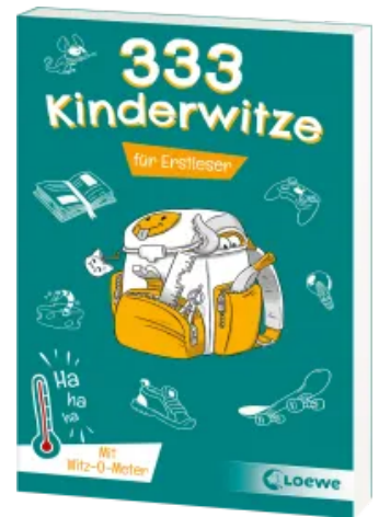
333 Kinderwitze - Für Erstleser Taschenbuch