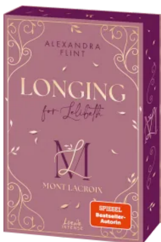
Mont Lacroix (Band 1) - Longing for Lelibeth Paperback