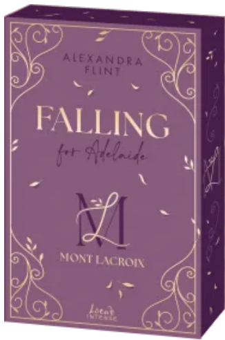
Mont Lacroix (Band 2) - Falling for Adelaide Paperback