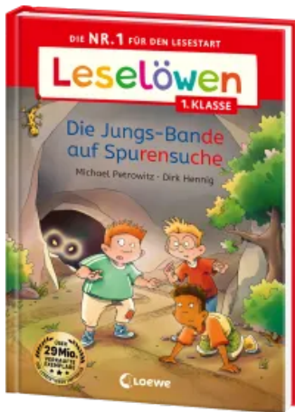
Leselöwen 1. Klasse - Die Jungs-Bande auf Spurensuche Hardcover