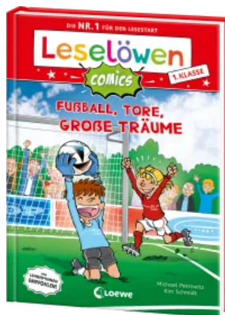
Leselöwen Comics 1. Klasse - Fußball, Tore, große Träume Hardcover