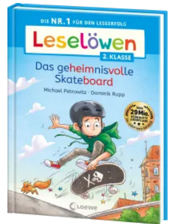
Leselöwen 2. Klasse - Das geheimnisvolle Skateboard Hardcover