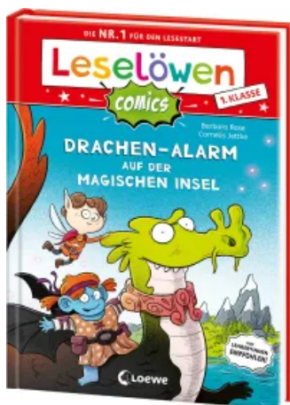
Leselöwen Comics 1. Klasse - Drachen-Alarm auf der magischen Insel Hardcover