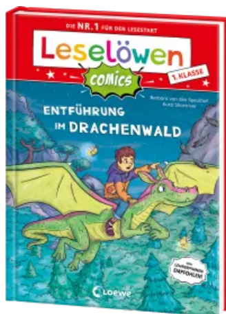
Leselöwen Comics 1. Klasse - Entführung im Drachenwald Hardcover