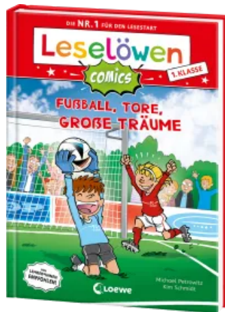
Leselöwen Comics 1. Klasse - Fußball, Tore, große Träume Hardcover