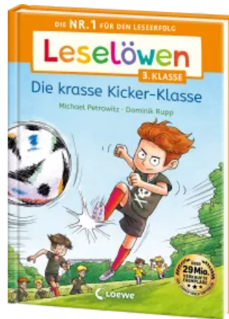
Leselöwen 3. Klasse - Die krasse Kicker-Klasse Hardcover