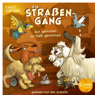
Die Straßengäng (Band 2) - Gut getrickst ist halb gewonnen Hörbuch