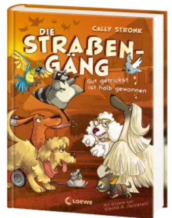
Die Straßengäng (Band 2) - Gut getrickst ist halb gewonnen Hardcover