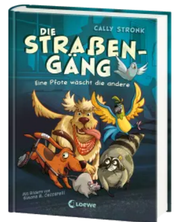
Die Straßengäng (Band 1) - Eine Pfote wäscht die andere Hardcover