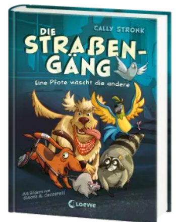
Die Straßengäng (Band 1) - Eine Pfote wäscht die andere Hardcover