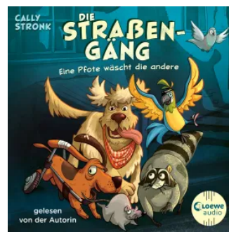
Die Straßengäng (Band 1) - Eine Pfote wäscht die andere Hörbuch