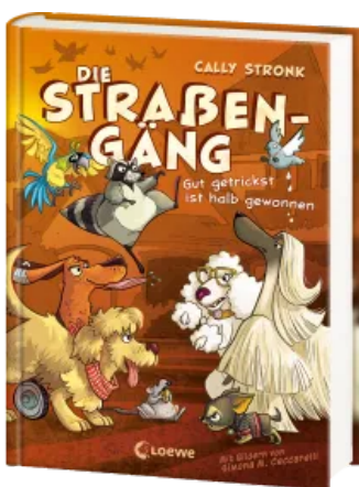
Die Straßengäng (Band 2) - Gut getrickst ist halb gewonnen Hardcover