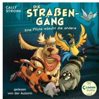
Die Straßengäng (Band 1) - Eine Pfote wäscht die andere Hörbuch