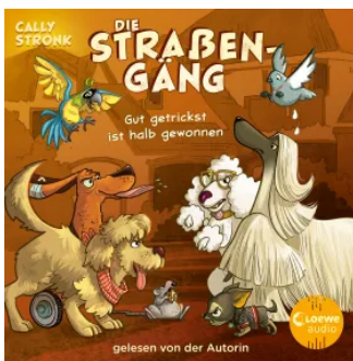
Die Straßengäng (Band 2) - Gut getrickst ist halb gewonnen Hörbuch