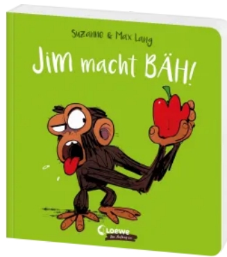
Jim macht BÄH! Hardcover