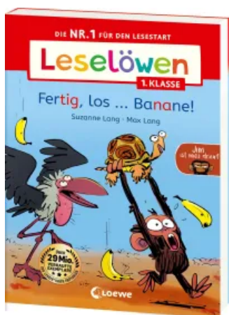
Leselöwen 1. Klasse - Jim ist mies drauf - Fertig, los...Banane! Taschenbuch