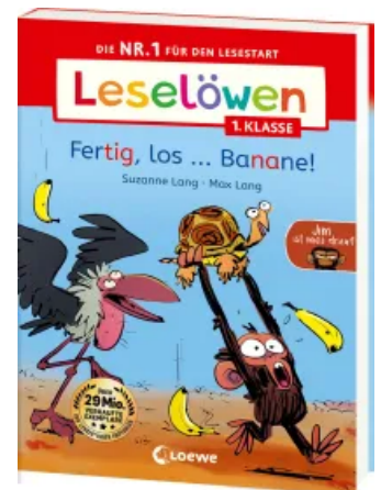
Leselöwen 1. Klasse - Jim ist mies drauf - Fertig, los...Banane!