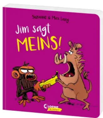
Jim sagt MEINS! Hardcover