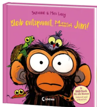
Bleib entspannt, Mama Jim!