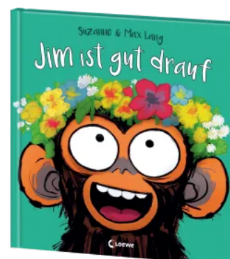
Jim ist gut drauf Hardcover