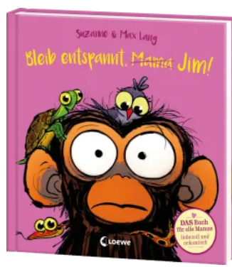
Bleib entspannt, Mama Jim! Hardcover