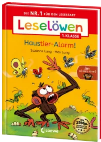
Leselöwen 1. Klasse - Jim ist mies drauf - Haustier- Alarm! Hardcover