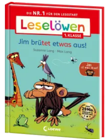
Leselöwen 1. Klasse - Jim ist mies drauf - Jim brütet etwas aus! Hardcover