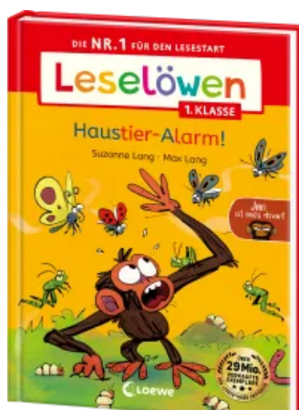
Leselöwen 1. Klasse - Jim ist mies drauf - Haustier- Alarm! Hardcover