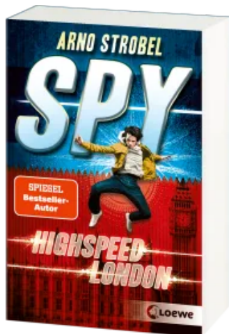
SPY (Band 1) - Highspeed London Taschenbuch