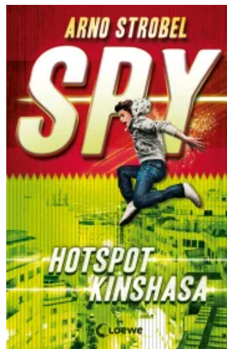
SPY (Band 2) - Hotspot Kinshasa Paperback