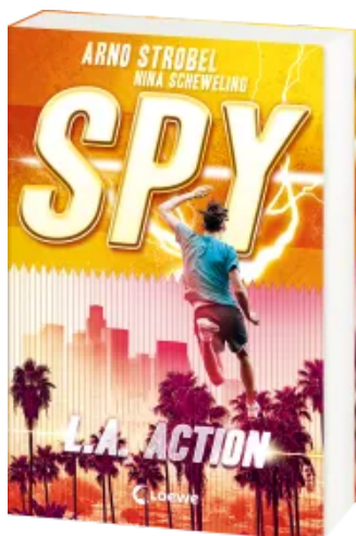
SPY (Band 4) - L.A. Action Paperback