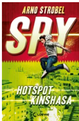
SPY (Band 2) - Hotspot Kinshasa Paperback