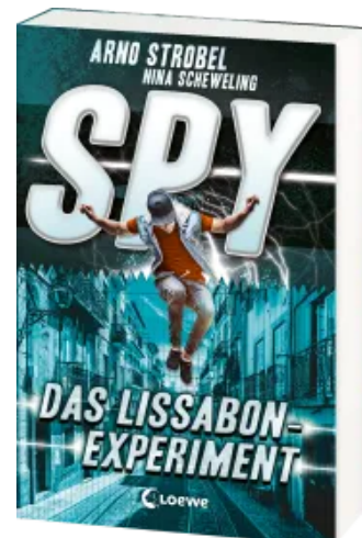
SPY (Band 5) - Das Lissabon-Experiment Paperback