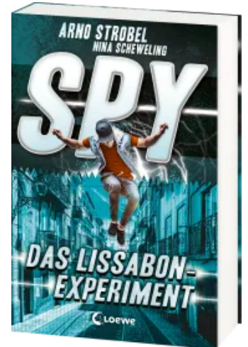
SPY (Band 5) - Das Lissabon-Experiment Paperback