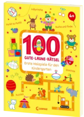
100 Gute-Laune-Rätsel - Erste Malspiele für den Kindergarten Taschenbuch