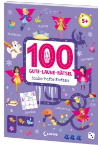
100 Gute-Laune-Rätsel - Zaubhafte Eisfeen Taschenbuch