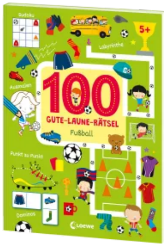
100 Gute-Laune-Rätsel - Fußball Taschenbuch