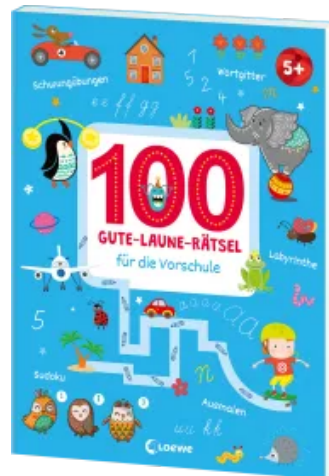
100 Gute-Laune-Rätsel für die Vorschule Taschenbuch