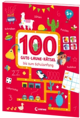
100 Gute-Laune-Rätsel bis zum Schulanfang Taschenbuch