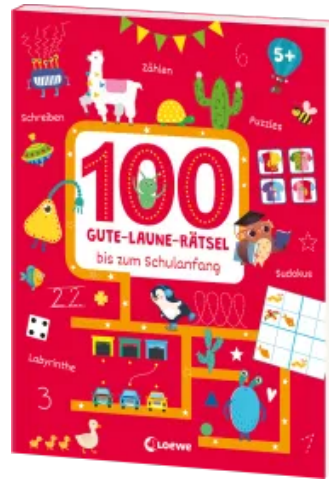
100 Gute-Laune-Rätsel bis zum Schulanfang Taschenbuch