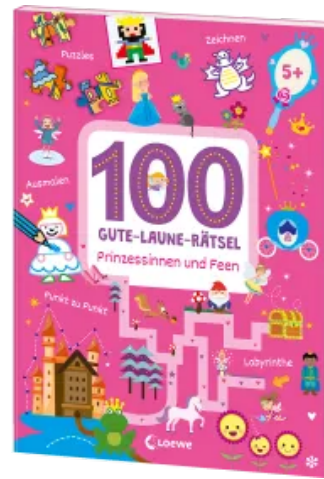
100 Gute-Laune-Rätsel - Prinzessinnen und Feen Taschenbuch