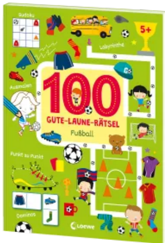
100 Gute-Laune-Rätsel - Fußball Taschenbuch