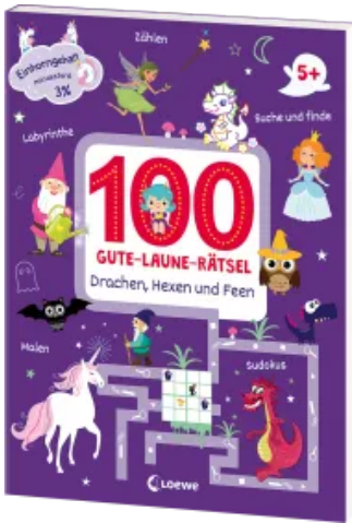
100 Gute-Laune-Rätsel - Drachen, Hexen und Feen Taschenbuch