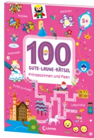
100 Gute-Laune-Rätsel - Prinzessinnen und Feen Taschenbuch