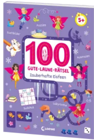
100 Gute-Laune-Rätsel - Zaubhafte Eisfeen Taschenbuch