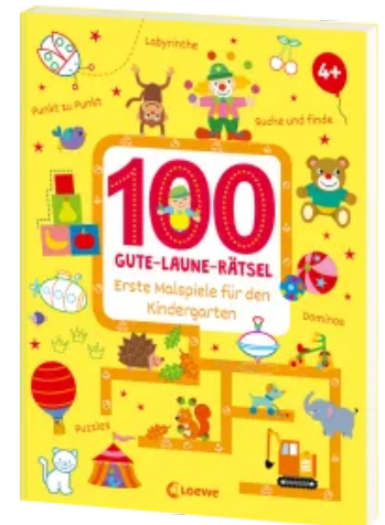
100 Gute-Laune-Rätsel - Erste Malspiele für den Kindergarten Taschenbuch