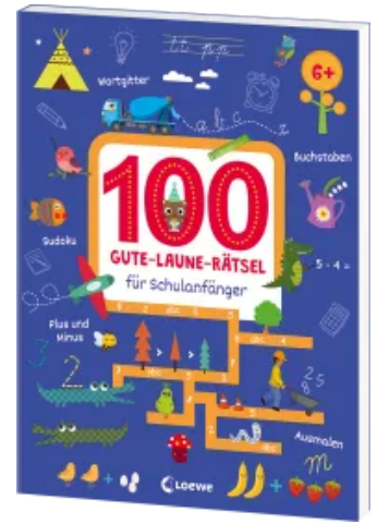
100 Gute-Laune-Rätsel für Schulanfänger Taschenbuch