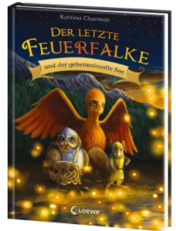
Der letzte Feuerfalke und der geheimnisvolle See (Band 4) Hardcover