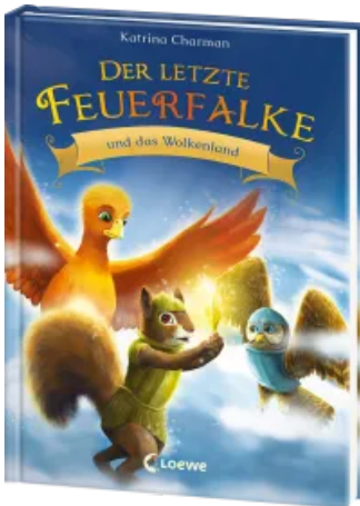
Der letzte Feuerfalke und das Wolkenland (Band 7) Hardcover