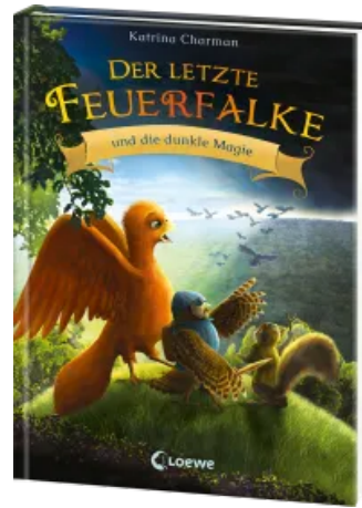
Der letzte Feuerfalke und die dunkle Magie (Band 6) Hardcover