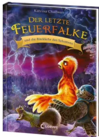
Der letzte Feuerfalke und die Rückkehr des Schattens (Band 12) Hardcover