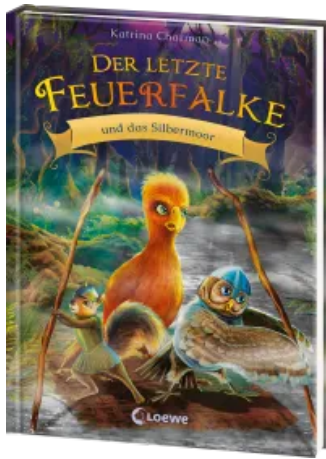
Der letzte Feuerfalke und das Silbermoor (Band 8) Hardcover