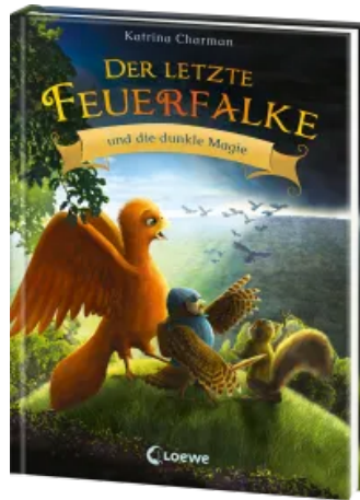
Der letzte Feuerfalke und die dunkle Magie (Band 6) Hardcover