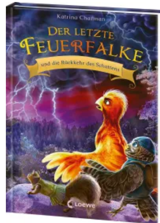
Der letzte Feuerfalke und die Rückkehr des Schattens (Band 12) Hardcover