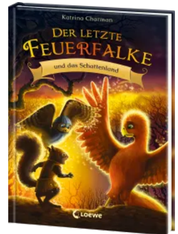
Der letzte Feuerfalke und das Schattenland (Band 5) Hardcover