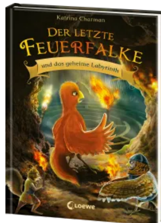
Der letzte Feuerfalke und das geheime Labyrinth (Band 10) Hardcover