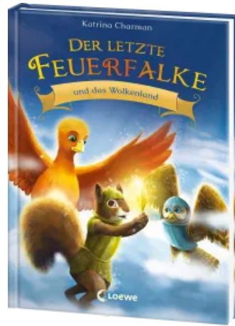
Der letzte Feuerfalke und das Wolkenland (Band 7) Hardcover