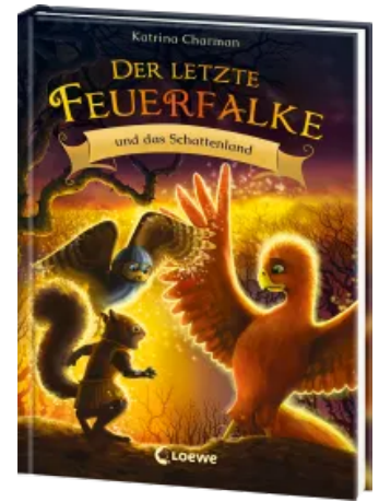
Der letzte Feuerfalke und das Schattenland (Band 5) Hardcover