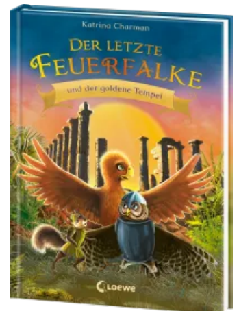
Der letzte Feuerfalke und der goldene Tempel (Band 9) Hardcover