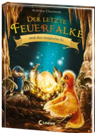
Der letzte Feuerfalke und das magische Ei (Band 13) Hardcover