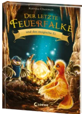
Der letzte Feuerfalke und das magische Ei (Band 13) Hardcover