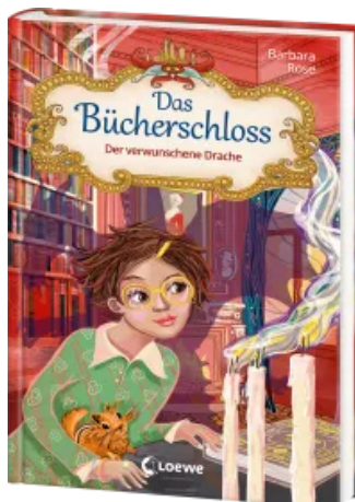
Das Bücherschloss (Band 7) - Der verwunschene Drache Hardcover