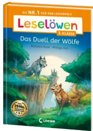
Leselöwen 3. Klasse - Das Duell der Wölfe Hardcover