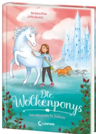
Die Wolkenponys (Band 3) - Das verzauberte Schloss Hardcover