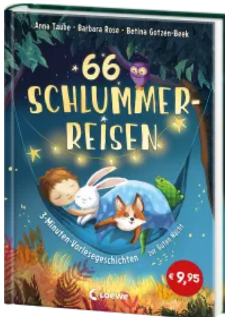
66 Schlummerreisen - 3-Minuten-Vorlesegeschichten zur Guten Nacht Hardcover