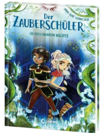
Der Zauberschüler (Band 7) - Die verschwundene Waldfee Hardcover