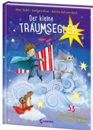
Der kleine Traumsegler (Band 3) Hardcover