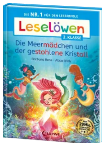
Leselöwen 2. Klasse - Die Meermädchen und der gestohlene Kristall Hardcover