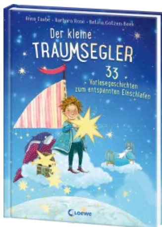
Der kleine Traumsegler (Band 2) Hardcover