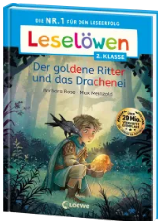
Leselöwen 2. Klasse - Der goldene Ritter und das Drachenei Hardcover