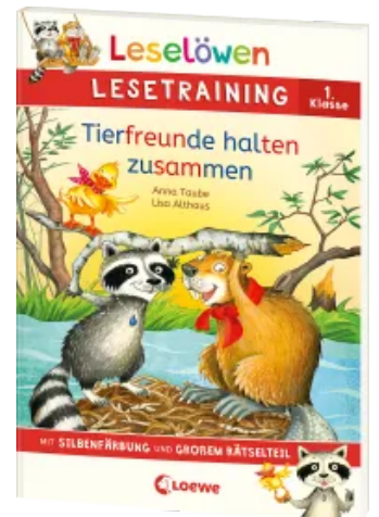
Leselöwen Lesetraining 1. Klasse - Tierfreunde halten zusammen Taschenbuch