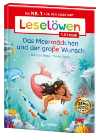
Leselöwen 1. Klasse - Das Meermädchen und der große Wunsch Hardcover