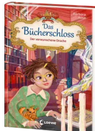
Das Bücherschloss (Band 7) - Der verwunschene Drache Hardcover