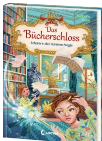
Das Bücherschloss (Band 6) - Schülerin der dunklen Magie Hardcover