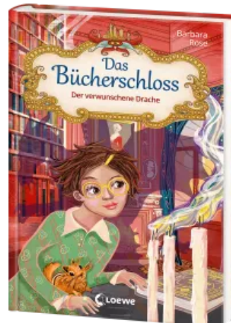
Das Bücherschloss (Band 7) - Der verwunschene Drache Hardcover