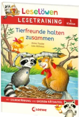
Leselöwen Lesetraining 1. Klasse - Tierfreunde halten zusammen Taschenbuch