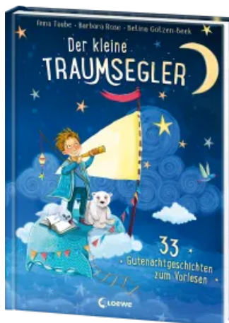
Der kleine Traumsegler (Band 1) Hardcover