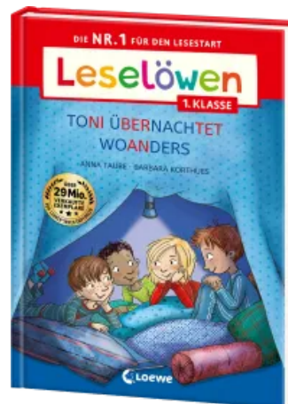
Leselöwen 1. Klasse - Toni übernachtet woanders (Großbuchstabenausgabe) Hardcover