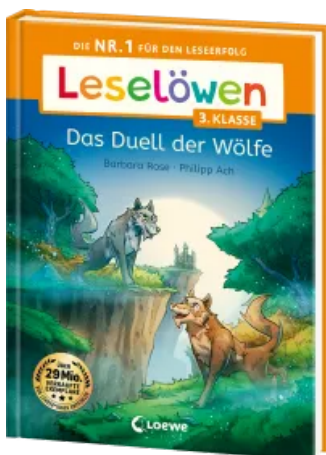
Leselöwen 3. Klasse - Das Duell der Wölfe Hardcover