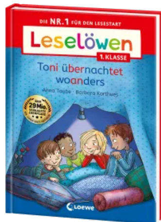
Leselöwen 1. Klasse - Toni übernachtet woanders Hardcover