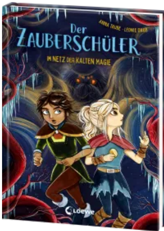
Der Zauberschüler (Band 8) - Im Netz der kalten Magie Hardcover