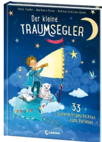
Der kleine Traumsegler (Band 1) Hardcover