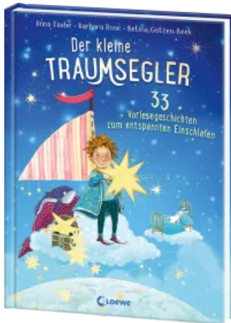
Der kleine Traumsegler (Band 2) Hardcover