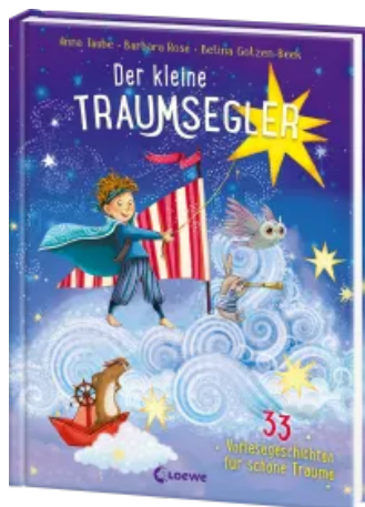
Der kleine Traumsegler (Band 3) Hardcover