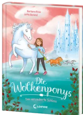
Die Wolkenponys (Band 3) - Das verzauberte Schloss Hardcover