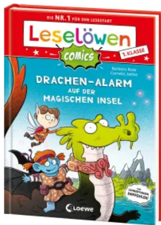
Leselöwen Comics 1. Klasse - Drachen-Alarm auf der magischen Insel Hardcover