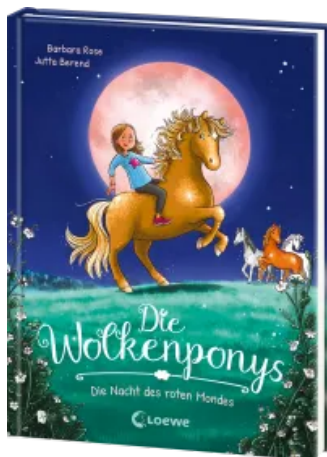
Die Wolkenponys (Band 2) - Die Nacht des roten Mondes Hardcover