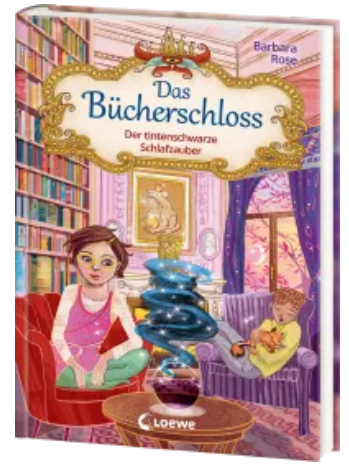
Das Bücherschloss (Band 5) - Der tintenschwarze Schlafzauber Hardcover