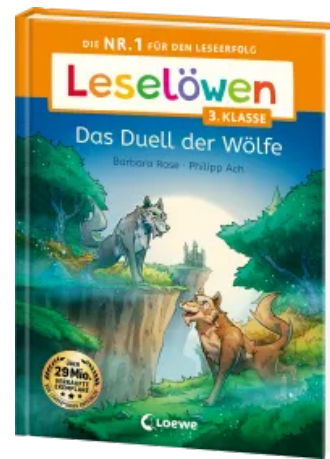
Leselöwen 3. Klasse - Das Duell der Wölfe Hardcover