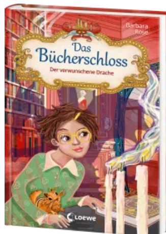
Das Bücherschloss (Band 7) - Der verwunschene Drache Hardcover