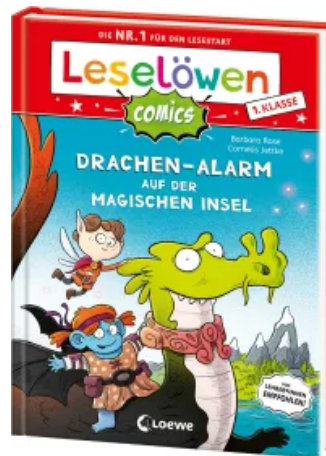
Leselöwen Comics 1. Klasse - Drachen-Alarm auf der magischen Insel Hardcover