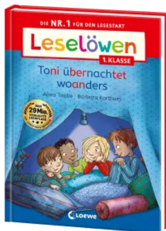
Leselöwen 1. Klasse - Toni übernachtet woanders Hardcover