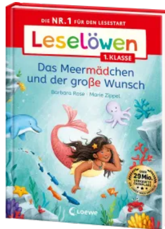
Leselöwen 1. Klasse - Das Meermädchen und der große Wunsch Hardcover