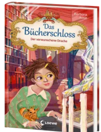
Das Bücherschloss (Band 7) - Der verwunschene Drache Hardcover