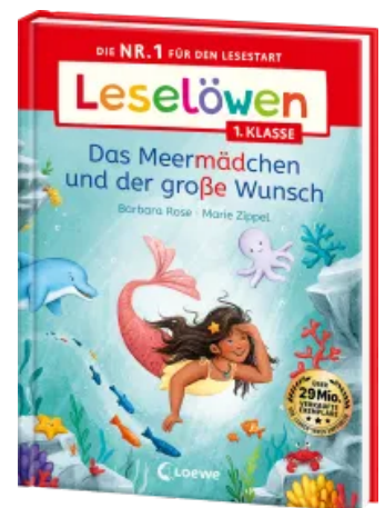
Leselöwen 1. Klasse - Das Meermädchen und der große Wunsch Hardcover