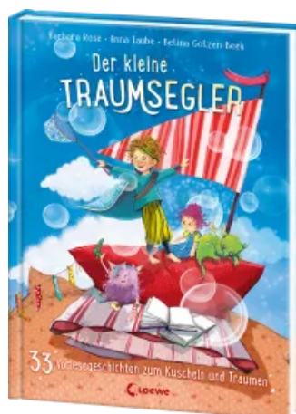
Der kleine Traumsegler (Band 4) Hardcover