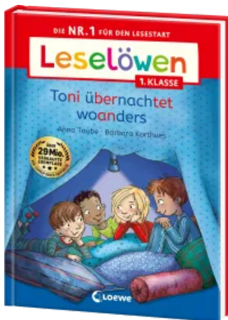
Leselöwen 1. Klasse - Toni übernachtet woanders Hardcover