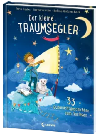
Der kleine Traumsegler (Band 1) Hardcover