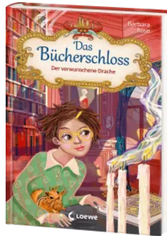
Das Bücherschloss (Band 7) - Der verwunschene Drache Hardcover