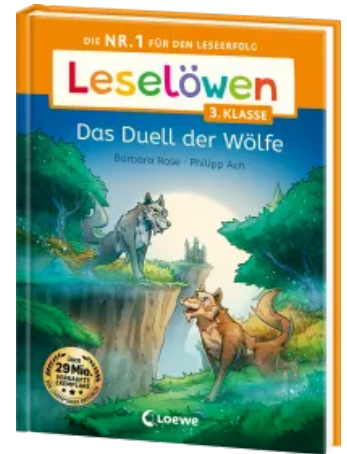
Leselöwen 3. Klasse - Das Duell der Wölfe Hardcover