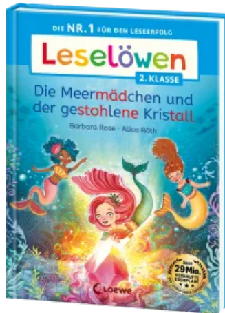
Leselöwen 2. Klasse - Die Meermädchen und der gestohlene Kristall Hardcover