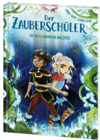
Der Zauberschüler (Band 7) - Die verschwundene Waldfee Hardcover