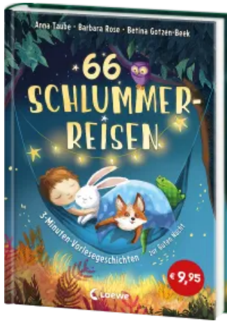
66 Schlummerreisen - 3-Minuten-Vorlesegeschichten zur Guten Nacht Hardcover