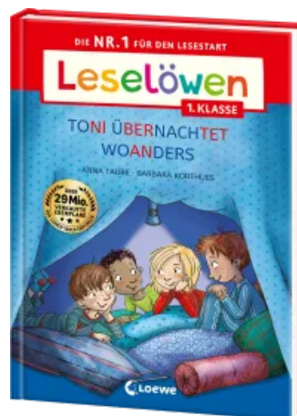
Leselöwen 1. Klasse - Toni übernachtet woanders (Großbuchstabenausgabe) Hardcover