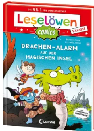
Leselöwen Comics 1. Klasse - Drachen-Alarm auf der magischen Insel Hardcover