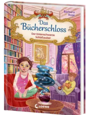
Das Bücherschloss (Band 5) - Der tintenschwarze Schlafzauber Hardcover