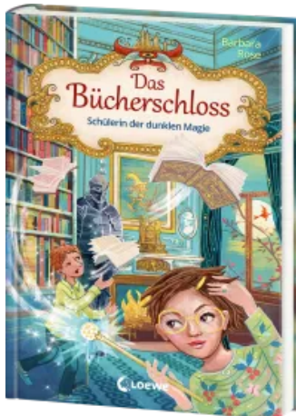
Das Bücherschloss (Band 6) - Schülerin der dunklen Magie Hardcover