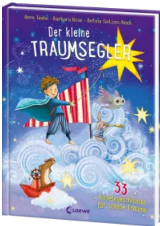
Der kleine Traumsegler (Band 3) Hardcover