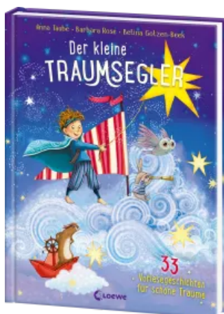
Der kleine Traumsegler (Band 3) Hardcover