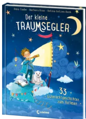
Der kleine Traumsegler (Band 1) Hardcover