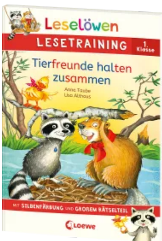
Leselöwen Lesetraining 1. Klasse - Tierfreunde halten zusammen Taschenbuch