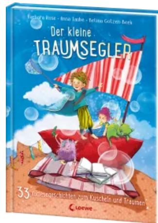
Der kleine Traumsegler (Band 4) Hardcover