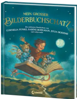
Mein großer Bilderbuchschatz Hardcover