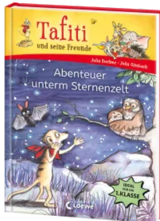
Tafiti und seine Freunde (Band 2) - Abenteuer unterm Sternenzelt Hardcover