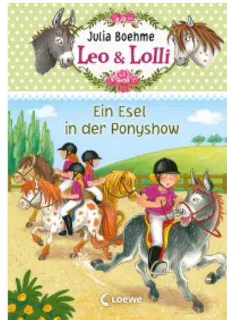
Leo & Lolli (Band 4) – Ein Esel in der Ponyshow Hardcover