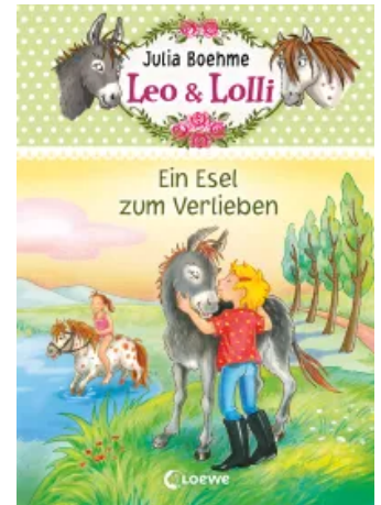
Leo & Lolli (Band 2) - Ein Esel zum Verlieben Unbekannt