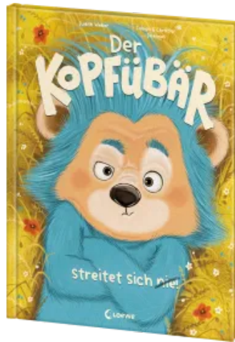
Der Kopfübär streitet sich nie! Hardcover