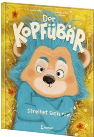
Der Kopfübär streitet sich nie! Hardcover