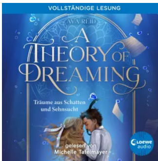
A Theory of Dreaming (A Study in Drowning, Band 2) Hörbuch