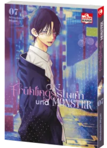
Frühlingssturm und Monster 07 Taschenbuch