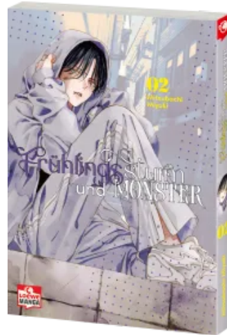
Frühlingssturm und Monster 02 Taschenbuch