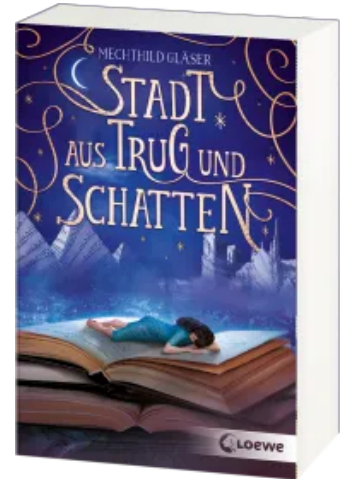
Stadt aus Trug und Schatten (Eisenheim- Dilogie, Band 1) Taschenbuch