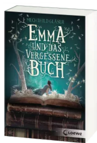
Emma und das vergessene Buch Taschenbuch