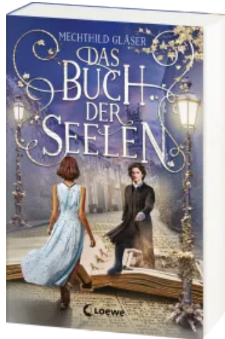
Das Buch der Seelen Paperback