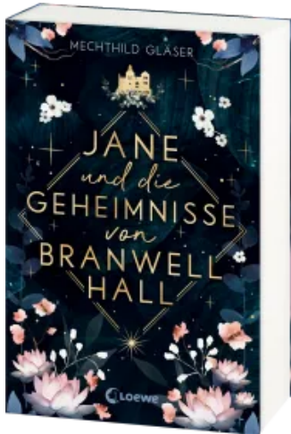
Jane und die Geheimnisse von Branwell Hall Paperback