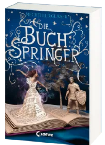
Die Buchspringer Taschenbuch