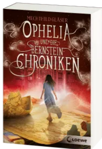
Ophelia und die Bernsteinchroniken Taschenbuch