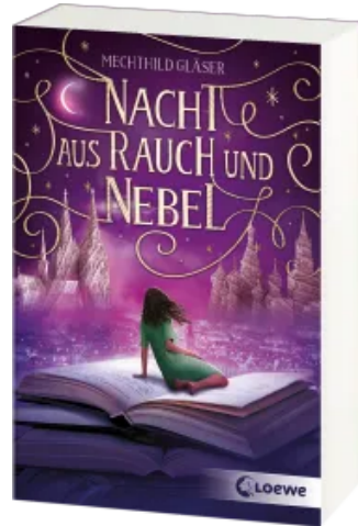
Nacht aus Rauch und Nebel (Eisenheim-Dilogie, Band 2) Taschenbuch