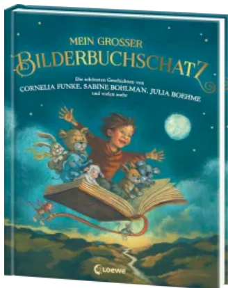
Mein großer Bilderbuchschatz Hardcover