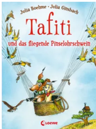
Tafiti und das fliegende Pinselohrschwein (Band 2) Hardcover