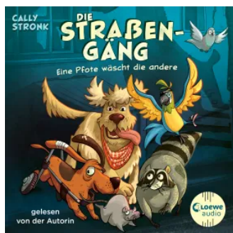
Die Straßengäng (Band 1) - Eine Pfote wäscht die andere Hörbuch