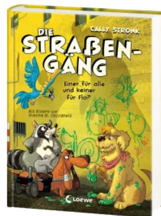
Die Straßengäng (Band 4) - Einer für alle und keiner für Flo? Hardcover