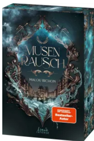
Musenrausch (Nektar und Ambrosia, Band 1)