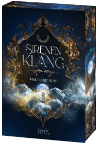
Sirenenklang (Nektar und Ambrosia, Band 3)