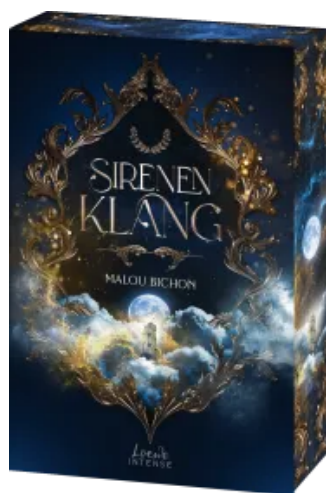
Sirenenklang (Nektar und Ambrosia, Band 3)