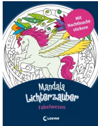
Mandala-Lichterzauber - Fabelwesen Taschenbuch