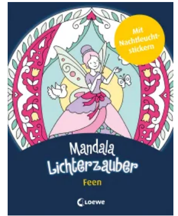
Mandala-Lichterzauber - Feen Taschenbuch