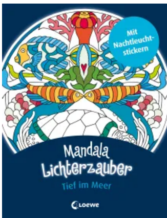
Mandala-Lichterzauber - Tief im Meer Taschenbuch