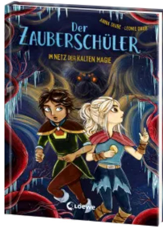
Der Zauberschüler (Band 8) - Im Netz der kalten Magie Hardcover