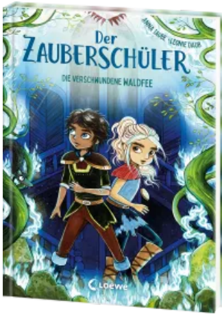
Der Zauberschüler (Band 7) - Die verschwundene Waldfee Hardcover