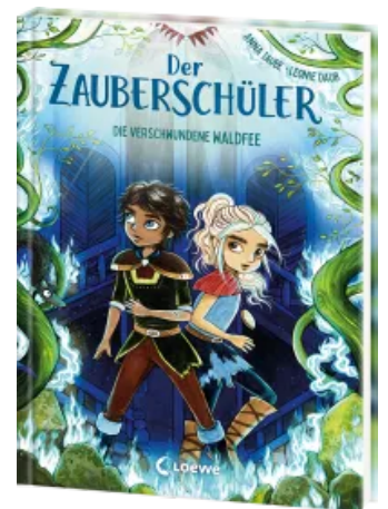
Der Zauberschüler (Band 7) - Die verschwundene Waldfee Hardcover