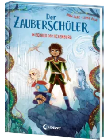
Der Zauberschüler (Band 5) - Im Kerker der Hexenburg Hardcover