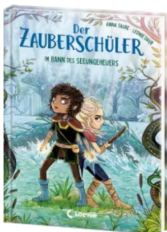
Der Zauberschüler (Band 2) - Im Bann des Seeungeheuers Hardcover