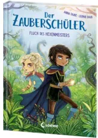
Der Zauberschüler (Band 1) - Fluch des Hexenmeisters Hardcover