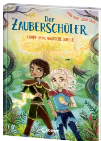
Der Zauberschüler (Band 4) - Kampf um die Magische Quelle Hardcover