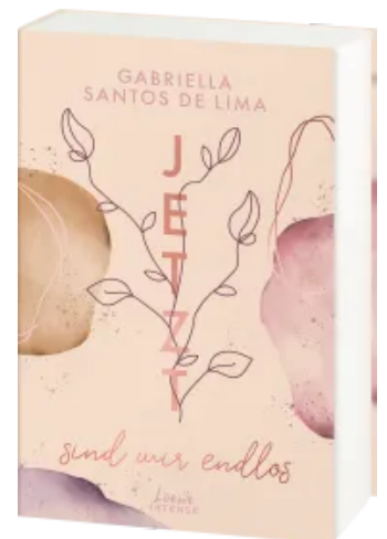
Jetzt sind wir endlos (Jetzt- Trilogie, Band 3) Paperback