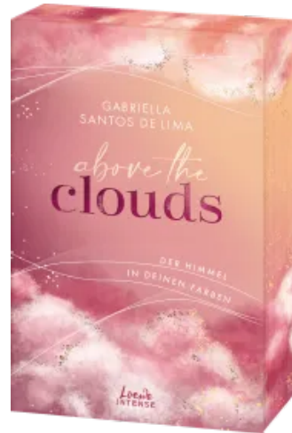
Above the Clouds (Band 1) - Der Himmel in deinen Farben Paperback