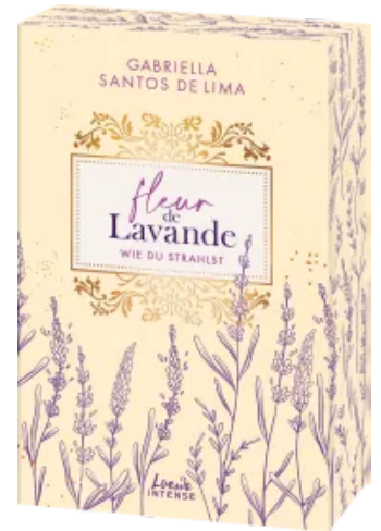
Fleur de Lavande (Band 2) - Wie du strahlst Paperback