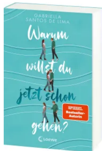
Warum willst du jetzt schon gehen? Paperback