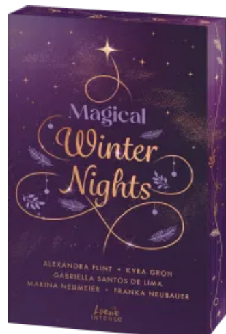
Magical Winter Nights Paperback