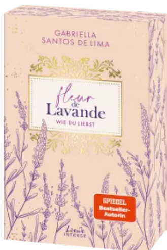
Fleur de Lavande (Band 1) - Wie du liebst Paperback