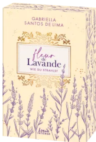
Fleur de Lavande (Band 2) - Wie du strahlst Paperback