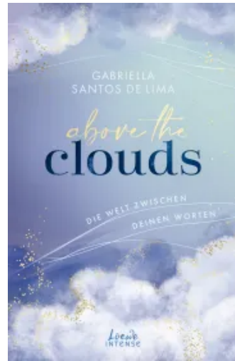
Above the Clouds (Band 2) - Die Welt zwischen deinen Worten Paperback