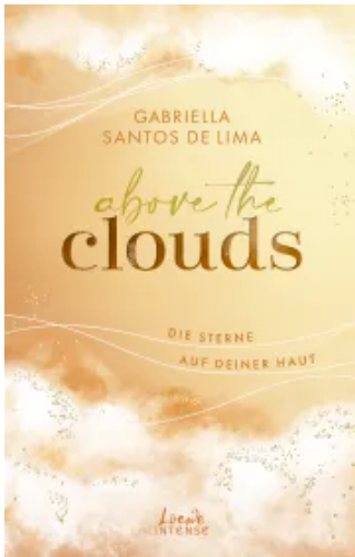
Above the Clouds (Band 3) - Die Sterne auf deiner Haut Paperback