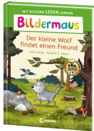
Bildermaus - Der kleine Wolf findet einen Freund Hardcover