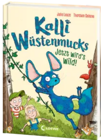
Kalli Wüstenmucks - Jetzt wird's wild! (Band 2) Hardcover