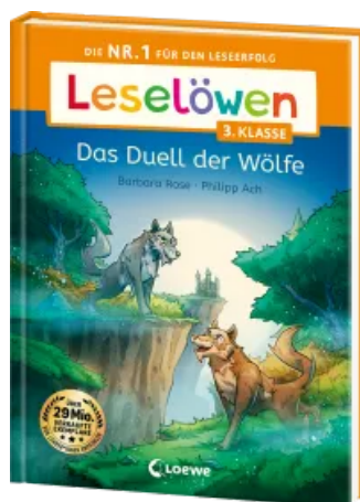
Leselöwen 3. Klasse - Das Duell der Wölfe Hardcover