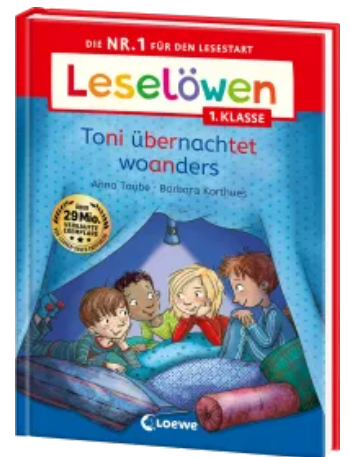
Leselöwen 1. Klasse - Toni übernachtet woanders Hardcover