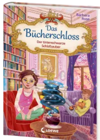
Das Bücherschloss (Band 5) - Der tintenschwarze Schlafzauber Hardcover