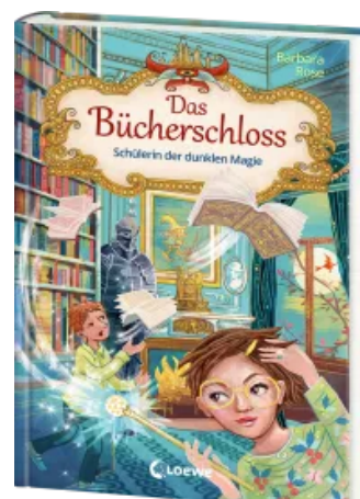
Das Bücherschloss (Band 6) - Schülerin der dunklen Magie Hardcover