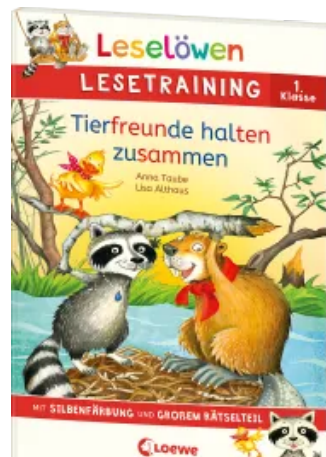
Leselöwen Lesetraining 1. Klasse - Tierfreunde halten zusammen Taschenbuch