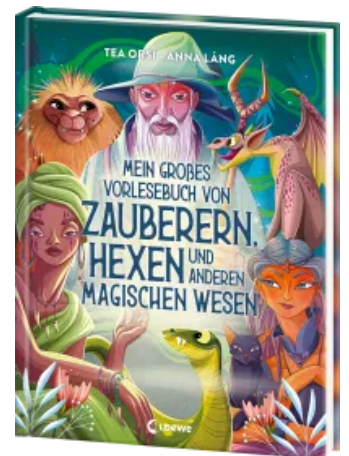
Mein großes Vorlesebuch von Zauberern, Hexen und anderen magischen Wesen Hardcover