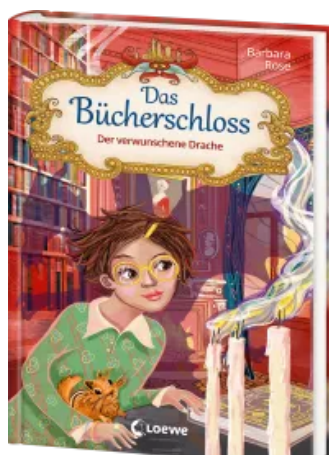
Das Bücherschloss (Band 7) - Der verwunschene Drache Hardcover