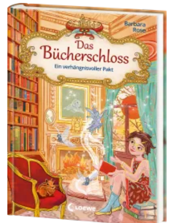
Das Bücherschloss (Band 4) - Ein verhängnisvoller Pakt Hardcover