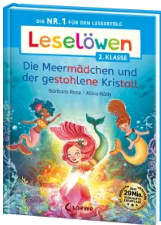
Leselöwen 2. Klasse - Die Meermädchen und der gestohlene Kristall Hardcover